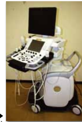
4D心エコー▶ (超音波診断装置)