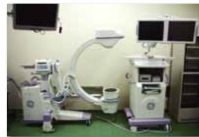
デジタルCアーム装置