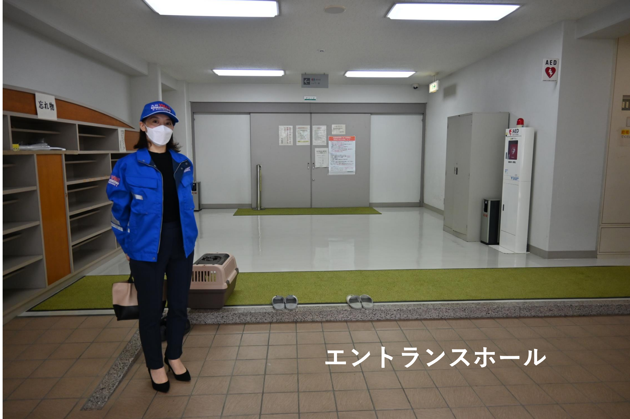
エントランスホール