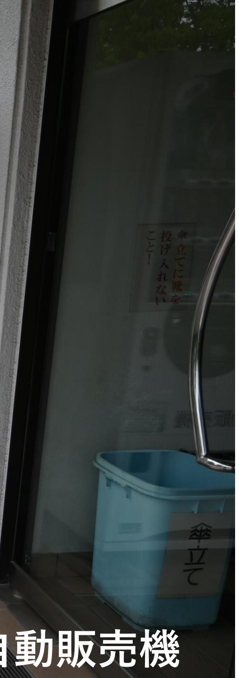
正面横の自動販売機