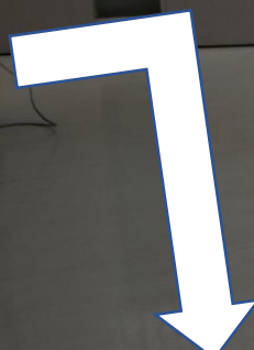
更衣室 (ペットの避難場所)