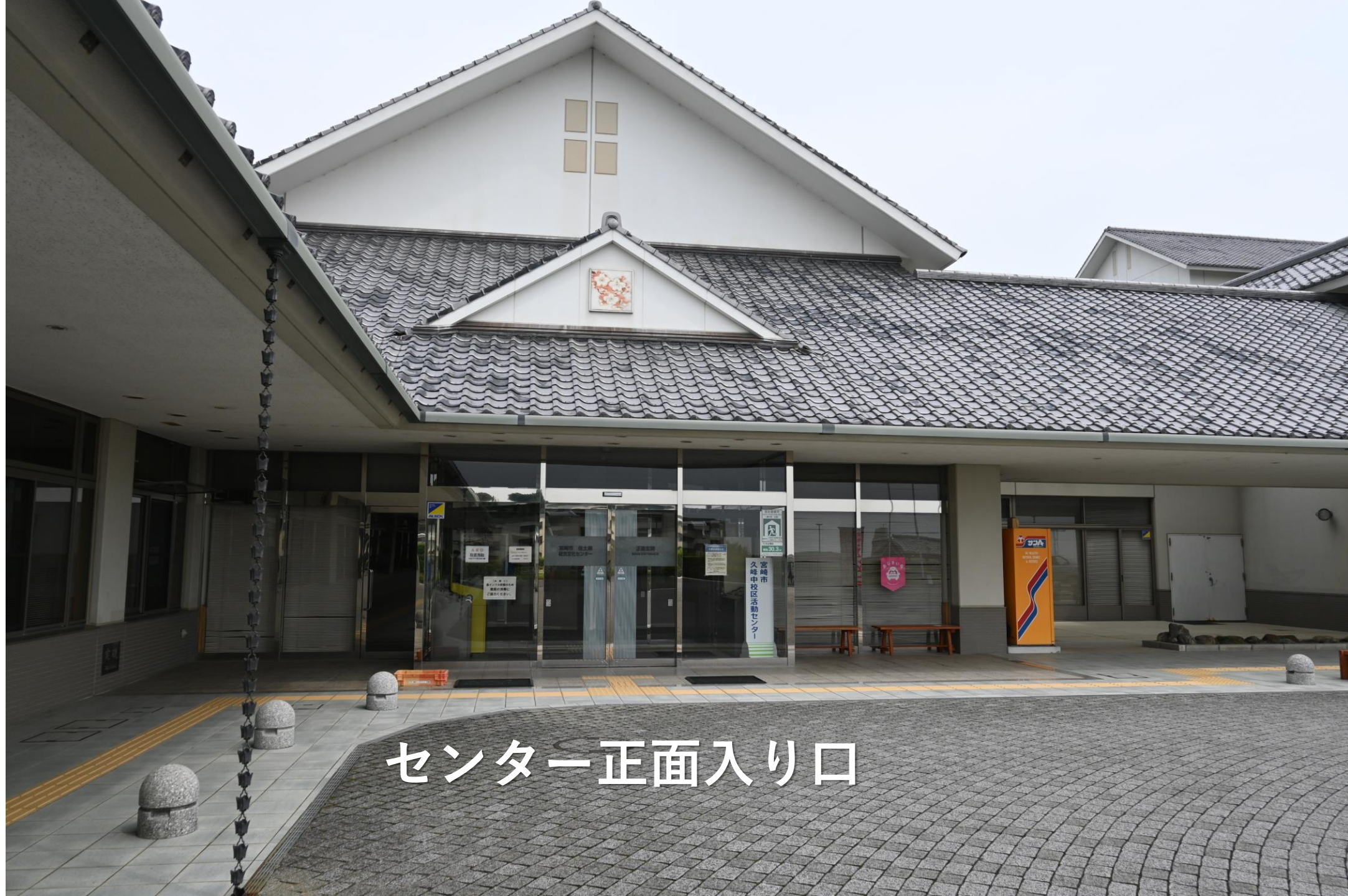
センター正面入り口