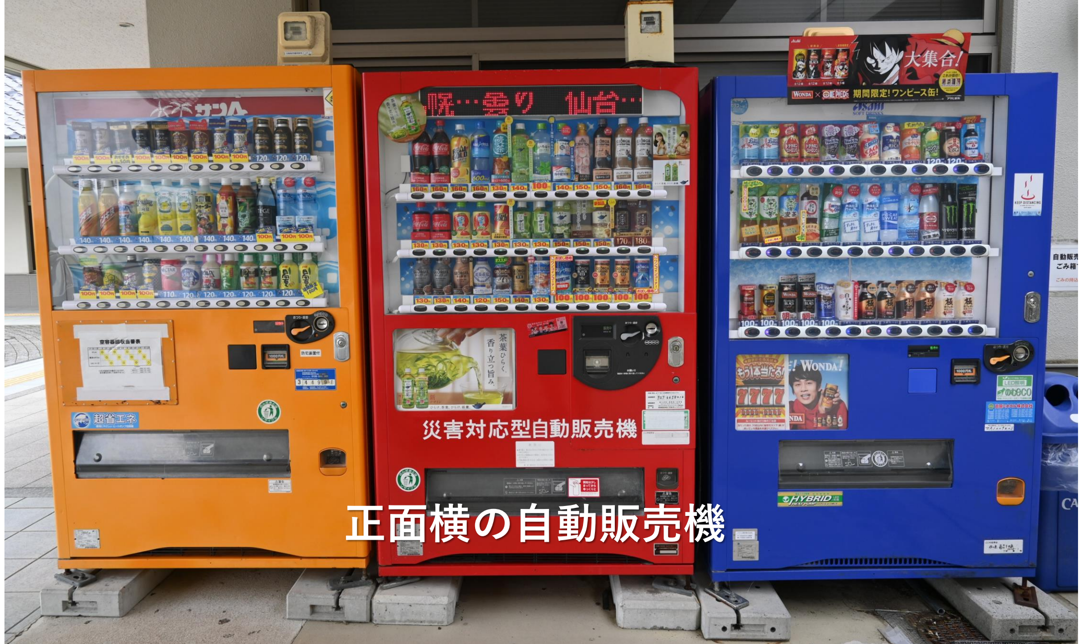
正面横の自動販売機